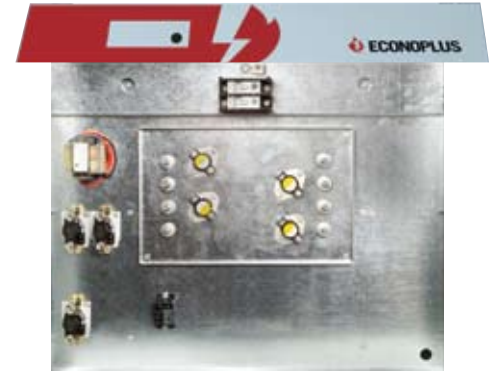
COMPARTIMENT DE CONTRÔLE

Pas de cheminée. Pas d'émissions néfastes pour l'environnement. 100% de la chaleur demeure à l'intérieur de la résidence. Propre et sans odeur, ECONOPLUS vous offre ce que le chauffage électrique a de meilleur à offrir.